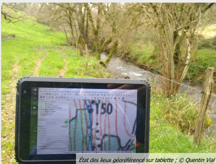
État des lieux géoréférencé sur tablette

EDITEUR: SyBTB, 2 la petite rivière, 16110 AGRIS IMPRIMEUR: Mediaprint et Co, Z.E. Les Pièces de l'Age, BP 60018, 16260 CHASSENEUIL SUR BONNIEURE CONCEPTION, REDACTION: Quentin VIAL ILLUSTRATIONS: Quentin VIAL, Emmanuel ROJO-DIAZ, Bruno PICAUDAT ISSN: 2966-7534