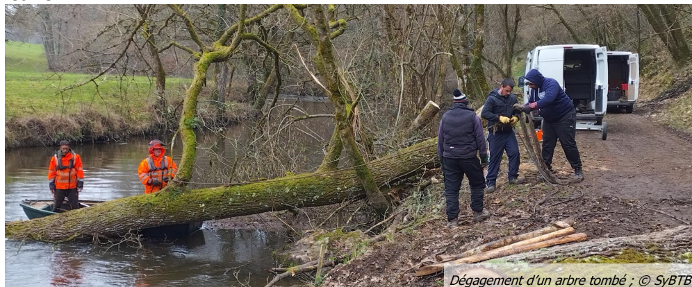
Dégagement d'un arbre tombé

La fixation et la réutilisation des arbres tombés dans le cours est privilégiée, mais l'évacuation des débris flottants dans le cours d'eau peut être nécessaire.