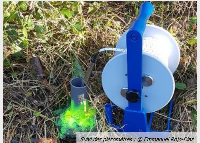
Suivi des piézomètres ; © Emmanuel Rojo-Diaz

L'installation de piézomètres avant travaux a permis de suivre l'évolution de la nappe d'accompagnement du cours d'eau.