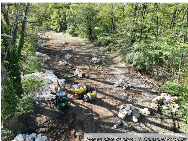
Mise en place de blocs

L'Association de Pêche de La Rochefoucauld (AAPPMA), désireuse de trouver des solutions alternatives aux lâchés de poissons , a participé financièrement à la réalisation de ces travaux.