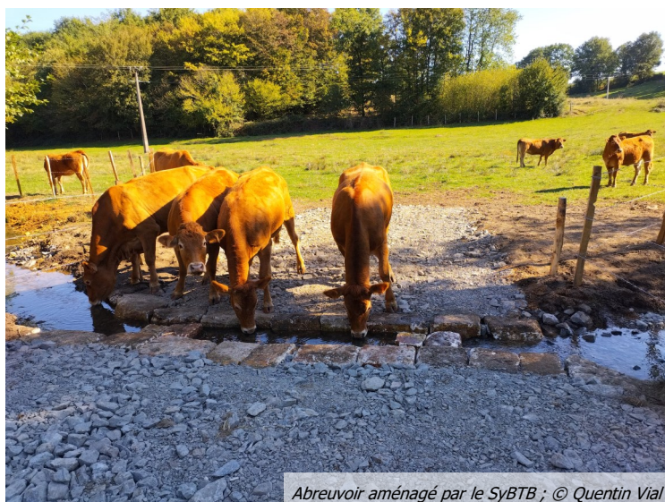
Abreuvoir aménagé par le SyBTB