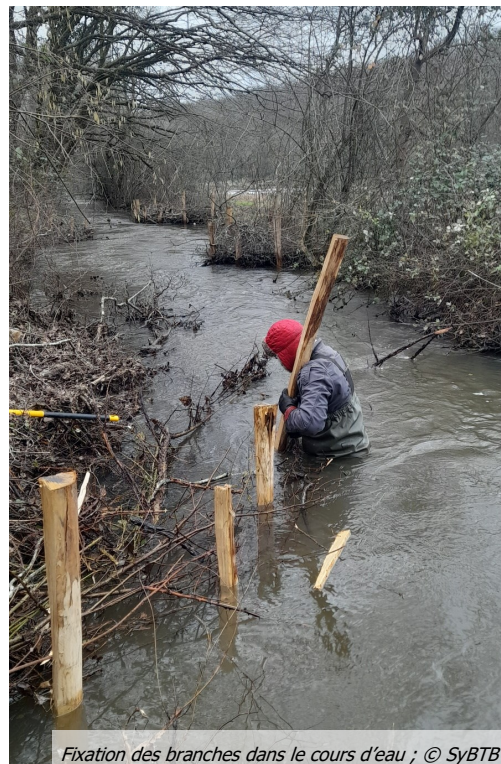
Fixation des branches dans le cours d'eau ; © SyBTB