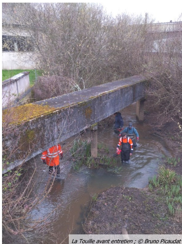
La Touille avant entretien