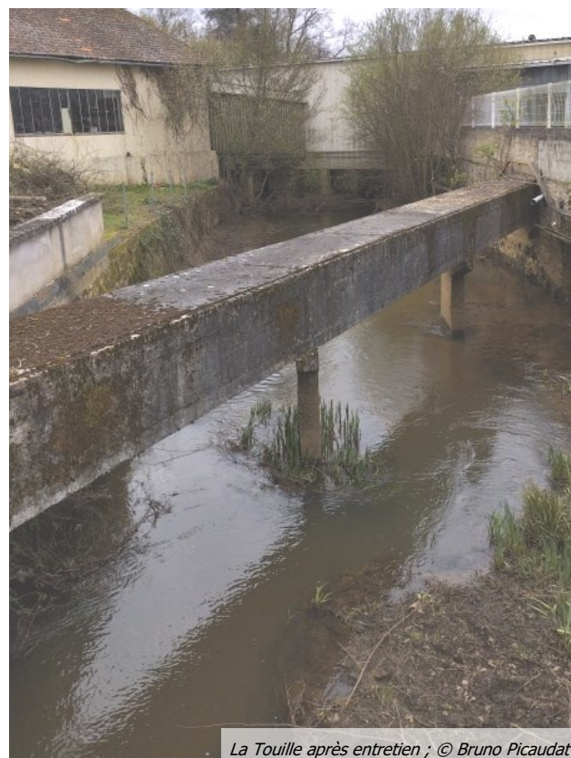
La Touille après entretien