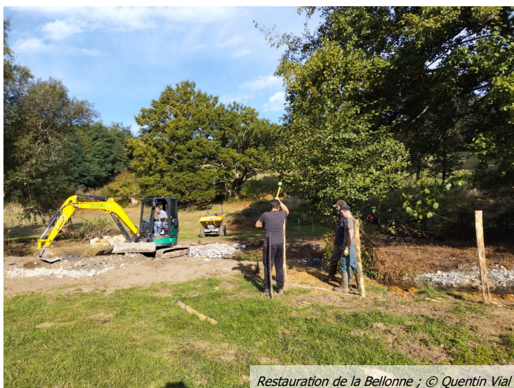
Restauration de la Bellonne