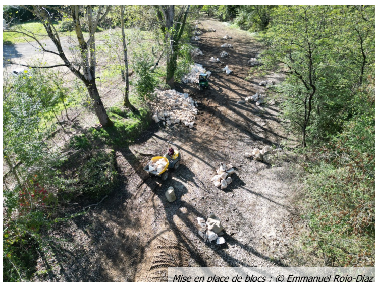
Mise en place de blocs ; © Emmanuel Rojo-Diaz