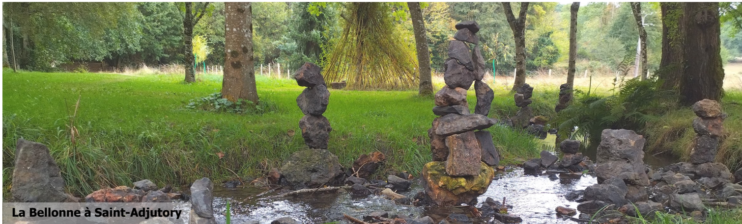
La Bellonne à Saint-Adjutory