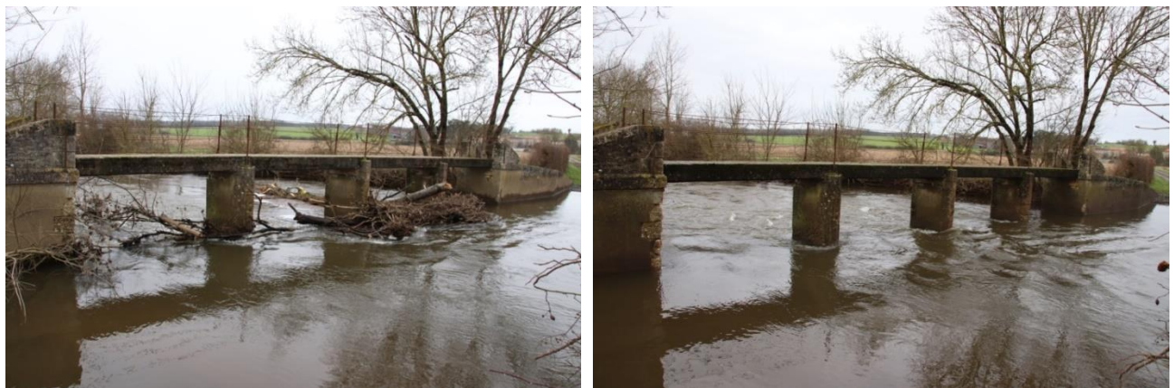
Entretien d'ouvrage, au Gué des Aillards