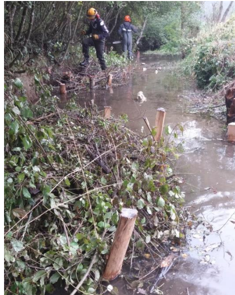
Installation de risberme sur la Bonnieure.